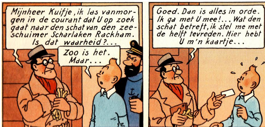
De avonturen van Kuifje. De schat van Scharlaken Rackham (1943).