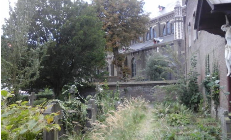
Een vergeten kerkhof te Kralingen: bij de Lambertuskerk.