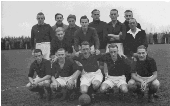
Het eerste elftal van Excelsior te Woudestein, 22 maart 1942.