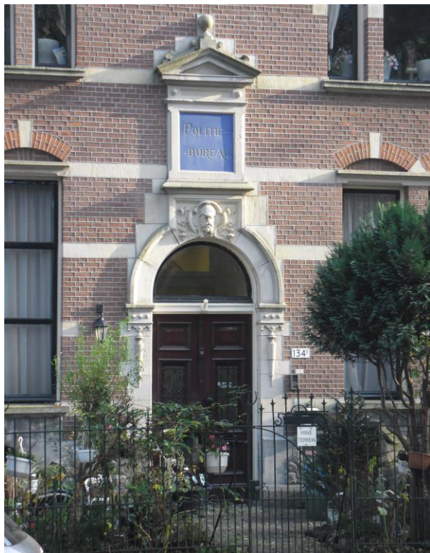
Politiebureau Hoflaan te Kralingen.

Marcus Tullius Cicero (106-43) over Gaius Verrus (115-43), praetor in Sicilië, 70 v.Chr. Cicero ad Verrum. Lib.4,3,1.