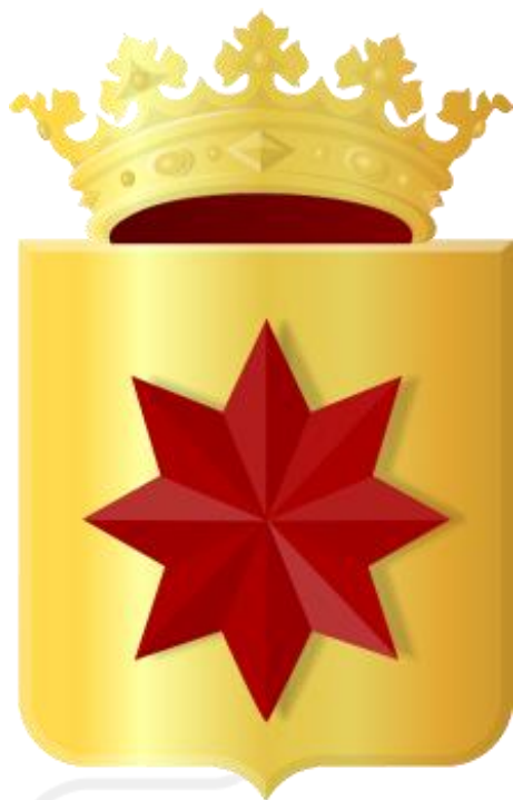
Het wapen van Kralingen.