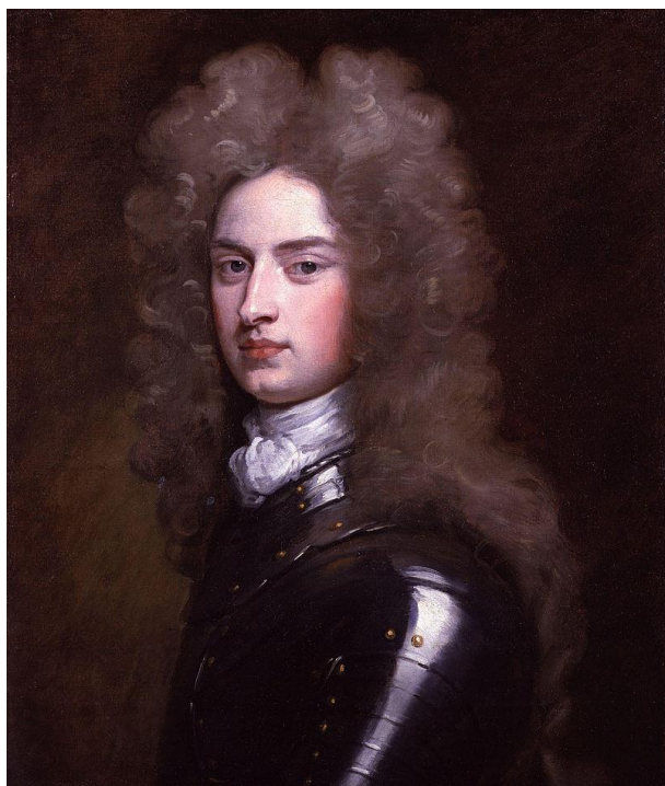
Arnold Joost van Keppel (1670-1718), graaf van Albermarle.

Aan het Volk van Nederland (pamflet, 1781) over stadhouder Willem III.