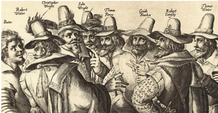
Guy Fawkes met de “buskruit-samenzweeiders” (1605).