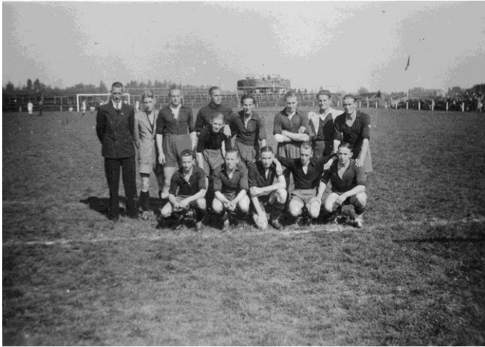
Het eerste elftal van Excelsior te Woudestein, 21 september 1941. Op de achtergrond zien we een installatie met Duits afweergeschut opgesteld staan (Flugabwehrkanone of 'Flak').