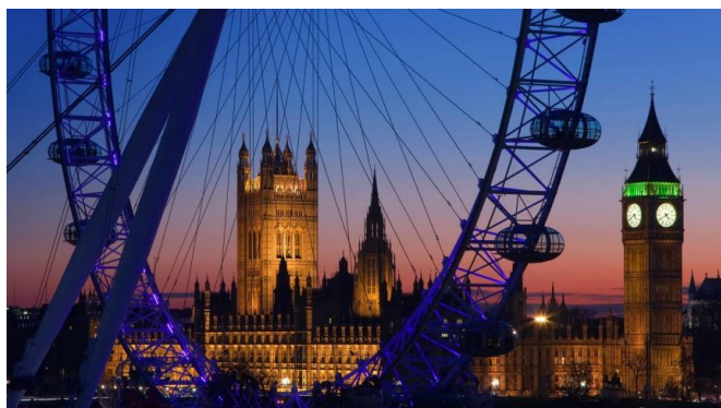
Londen. Op de voorgrond het “London Eye”.