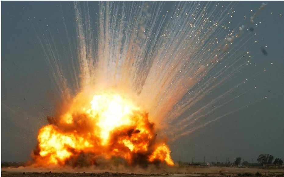
De gigantische explosie was tot ver buiten Amersfoort hoorbaar....

De reclamecampagne van Metropool Verzekeringen was ontploft, maar op een andere manier dan de marketingdeskundigen van het Rotterdamse bedrijf hadden verwacht. Gelukkig bleef het verlies beperkt tot één euro, de aanschafprijs die men voor het paleis had betaald.