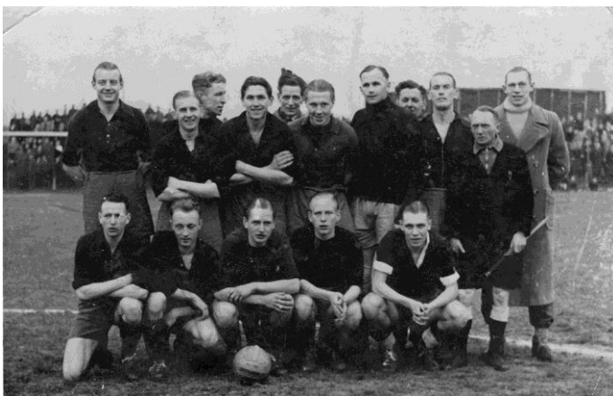
Het eerste elftal van Excelsior te Woudestein, seizoen 1942-1943 (geen datum bekend).