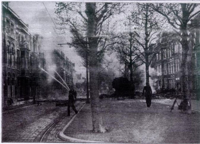
MEER DAN HONDERD VIJANDELIJKE VLIEGTUIGEN zijn gisteren ons grondgebied door ons luchtafweer-apparaat buiten gevecht gesteld. Foto boven: een Duitse bommenwerper stort brandend neer. — Onder: het struik en een Duitsch vliegtuig in een der straten van een Nederlandse stad; de brandweer bluscht het vuur, dat door het neergestorte toestel is veroorzaakt.