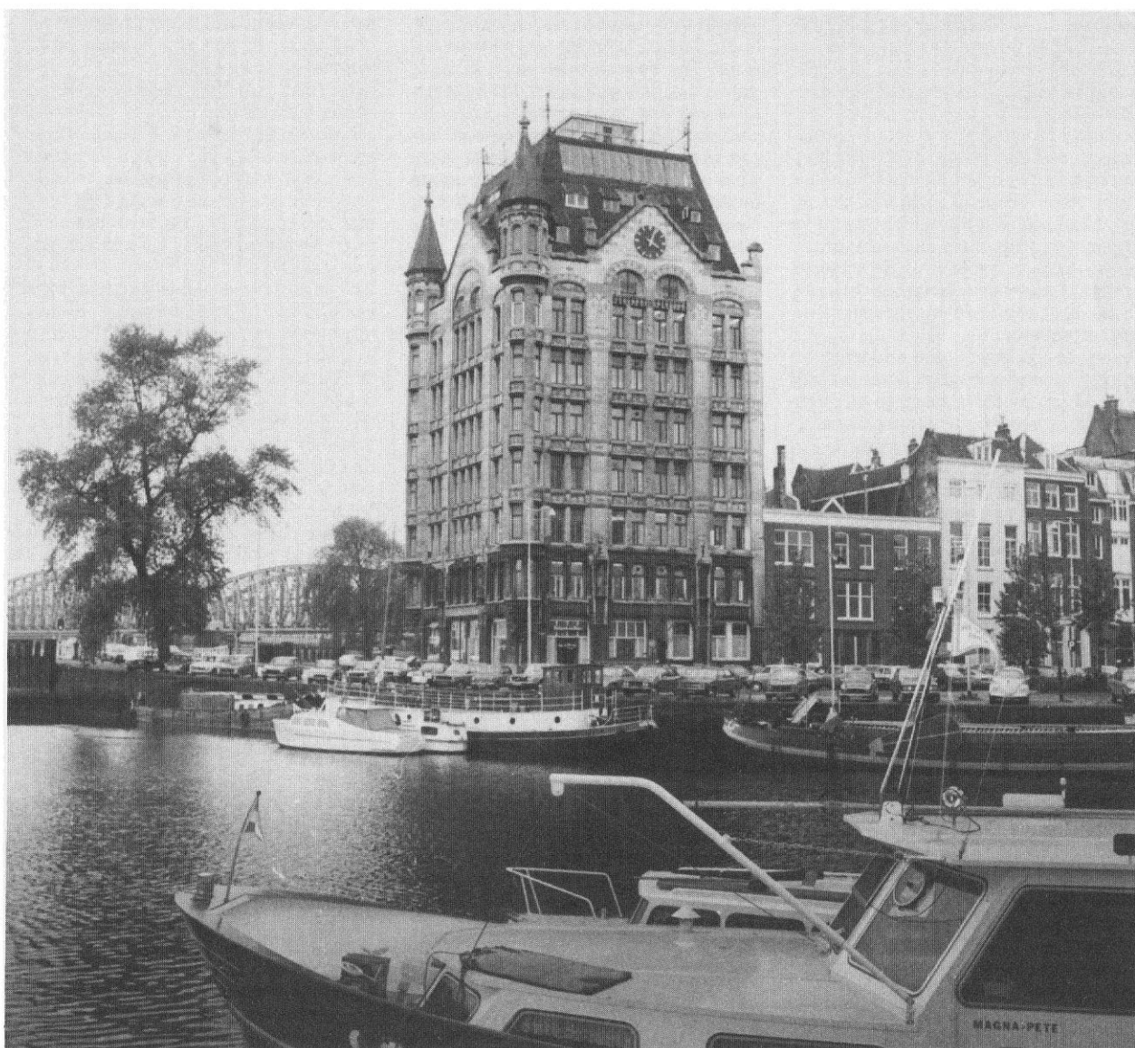
'Een van die bewuste panden tussen het Witte Huis en het spoorwegviaduct...'